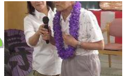
男性最高齢96歳の方のご挨拶！ユーモアにあふれ素晴らしいかったです！