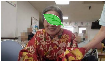
満面の笑みを浮かべた やるき満々の主演女優です！素晴らしい演技力でした！