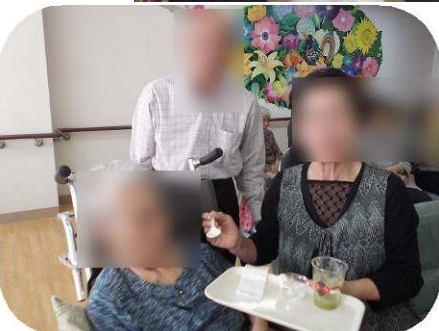
ご家族と楽しいひと時を過ごされました！