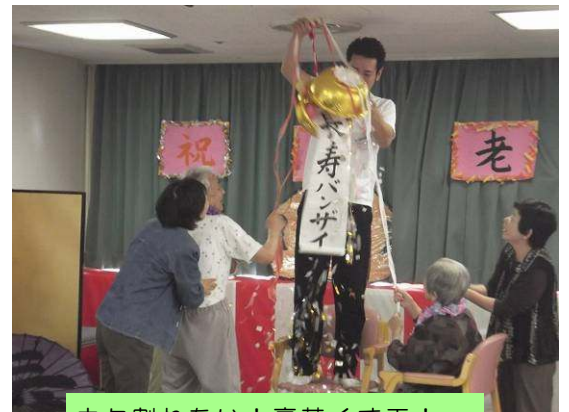
中々割れない！豪華くす玉！なんとか割れました！