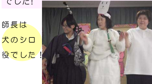
師長は犬のシロ役でした！