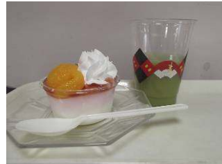
おやつは栄養管理室特製の「秋色ブラマンジェ」紅白でめでたく美味しかったです！